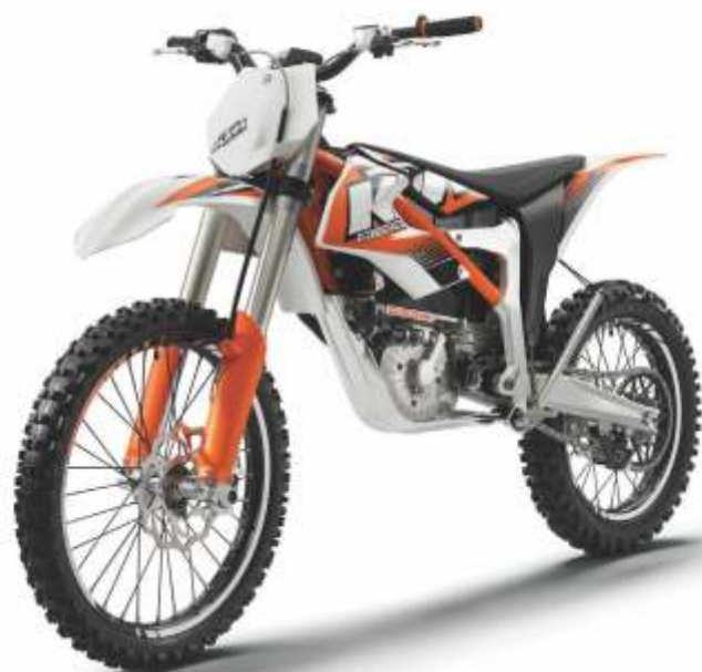
KTM FREERIDE E ELEKTRO-OFFROAD-MOTORRAD