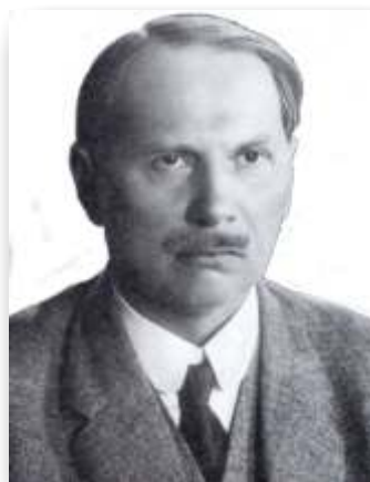
Viktor Kaplan 1876 - 1934

In 17 Archivkartons sind die Originale der Patente, die Professor Kaplan in den einzelnen Ländern erhielt, die während Kaplans wissenschaftlicher Arbeit entstandenen Materialien und die Dokumente aus den Patentverfahren enthalten.