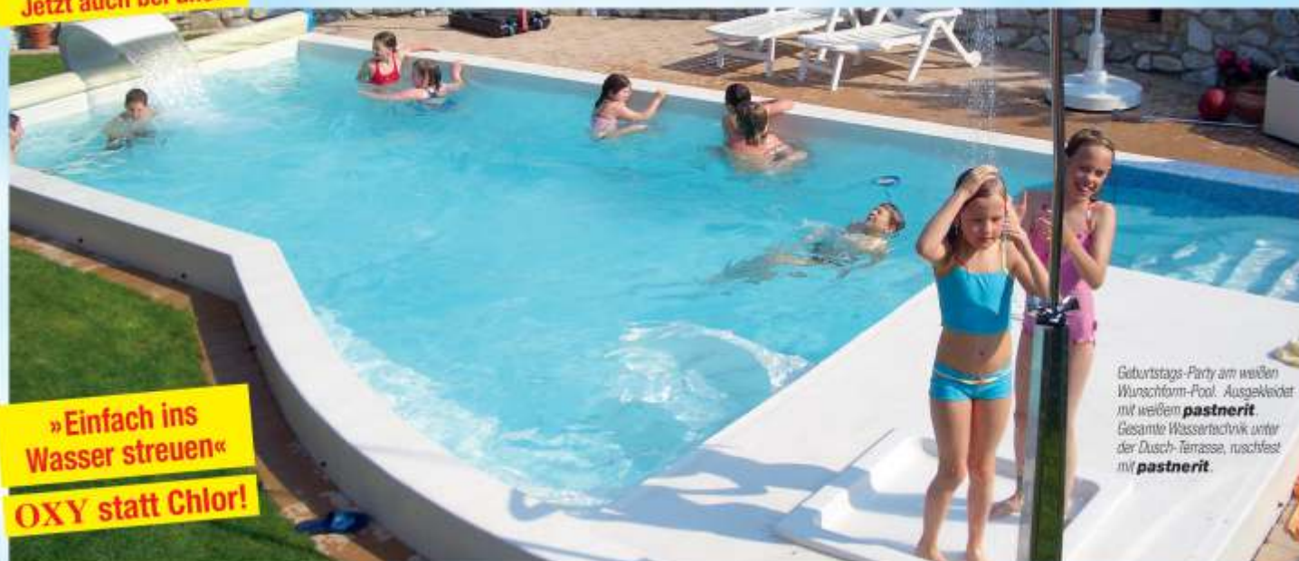
Geburts-Party am weißen Wunschform-Pool. Ausgewickelt mit weißem pastnerit . Gesamte Wassertechnik unter der Dusch-Terrasse, rutschfest mit pastnerit .

OXY-Pulver, das mineralische Fein-Granulat für Pool, Teich und Garten