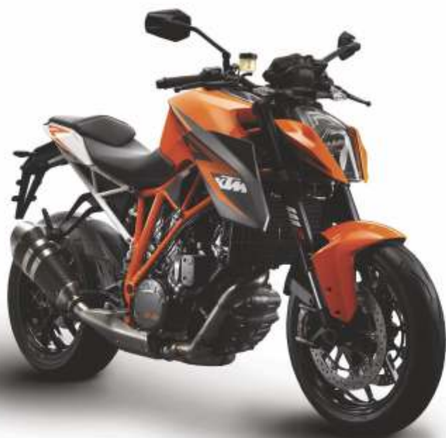
KTM 1290 SUPER DUKE R NAKED BIKE